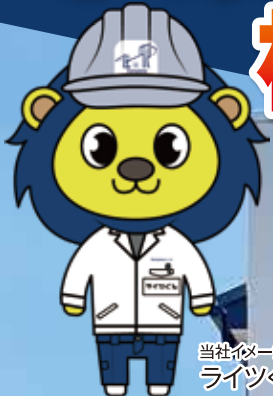
当社イメージキャラクター ライツくん