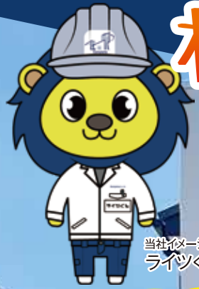
当社イメージキャラクター ライツくん

＼外装塗装をお考えの皆さん!!! その見積もりで満足ですか? 裏面をご覧ください!!